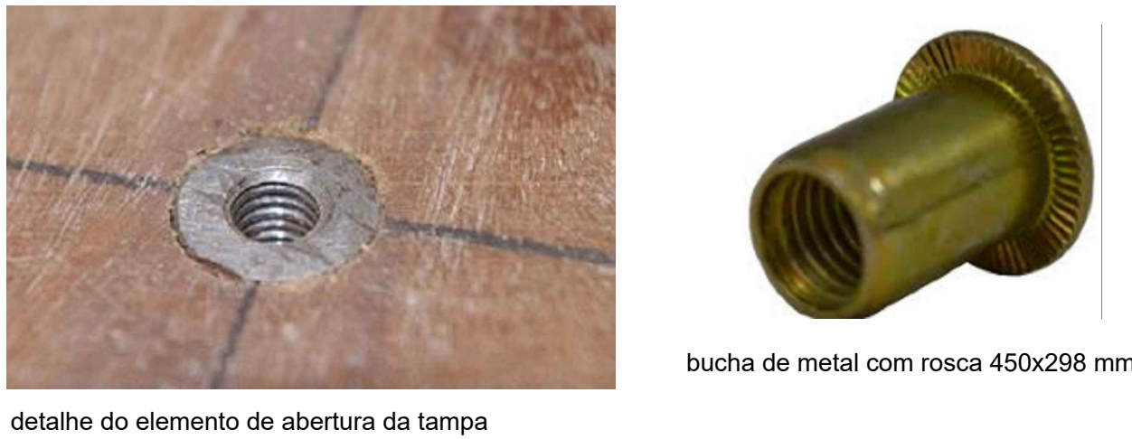
detalhe do elemento de abertura da tampa