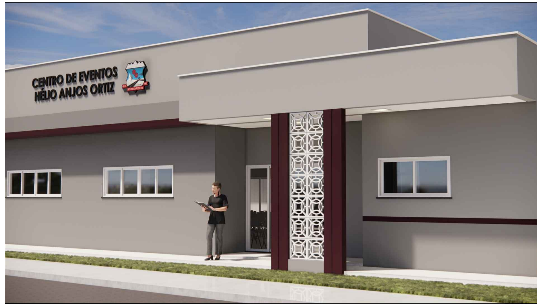
A14 VISTA DOS COBOGÓS EM FACHADA E ACESSO PRINCIPAL ESC. S/E