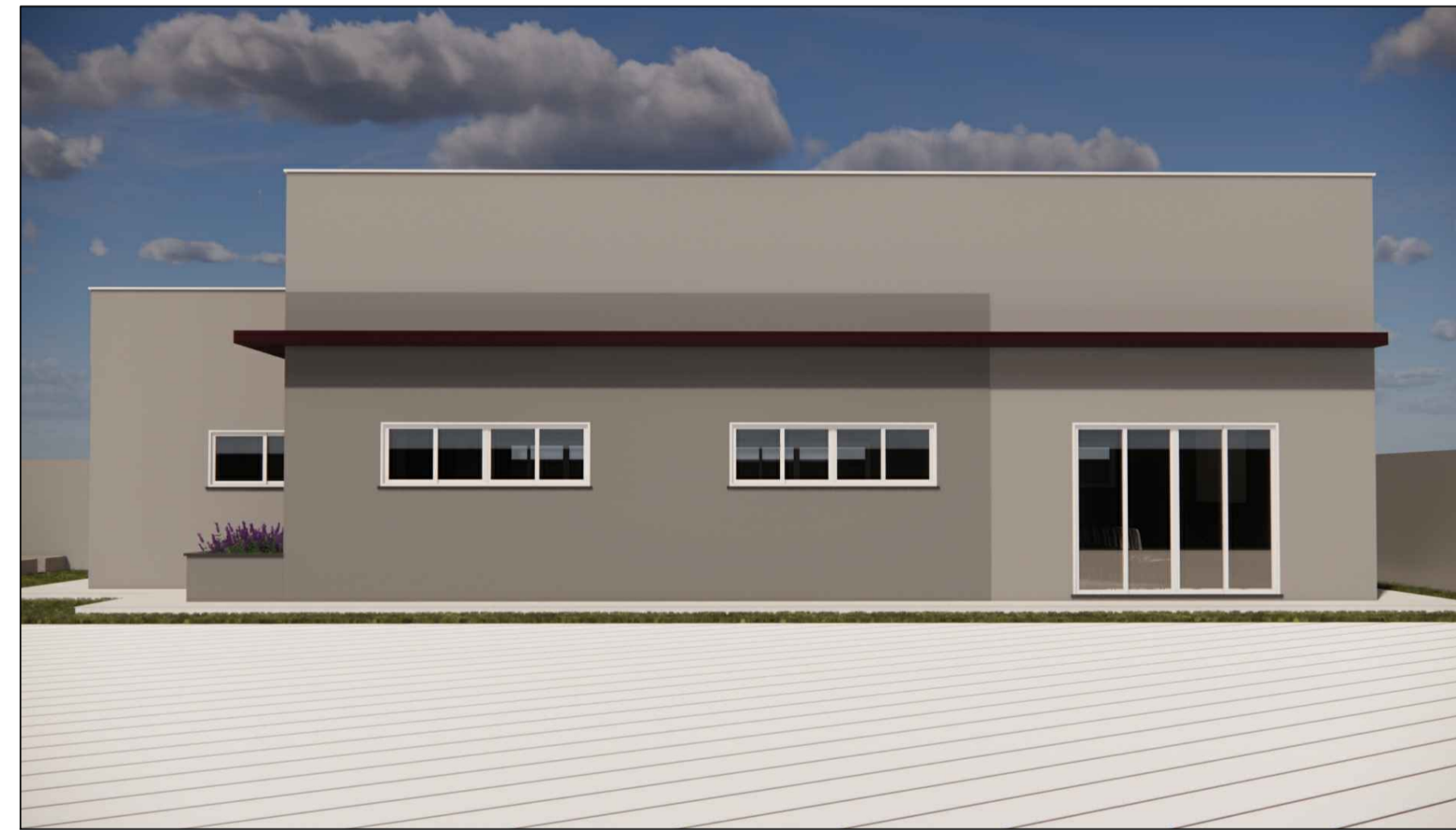
A16 VISTA PARALELA A ESCOLA (FACHADA FUNDOS DA EDIF. NOVA) ESC. S/E