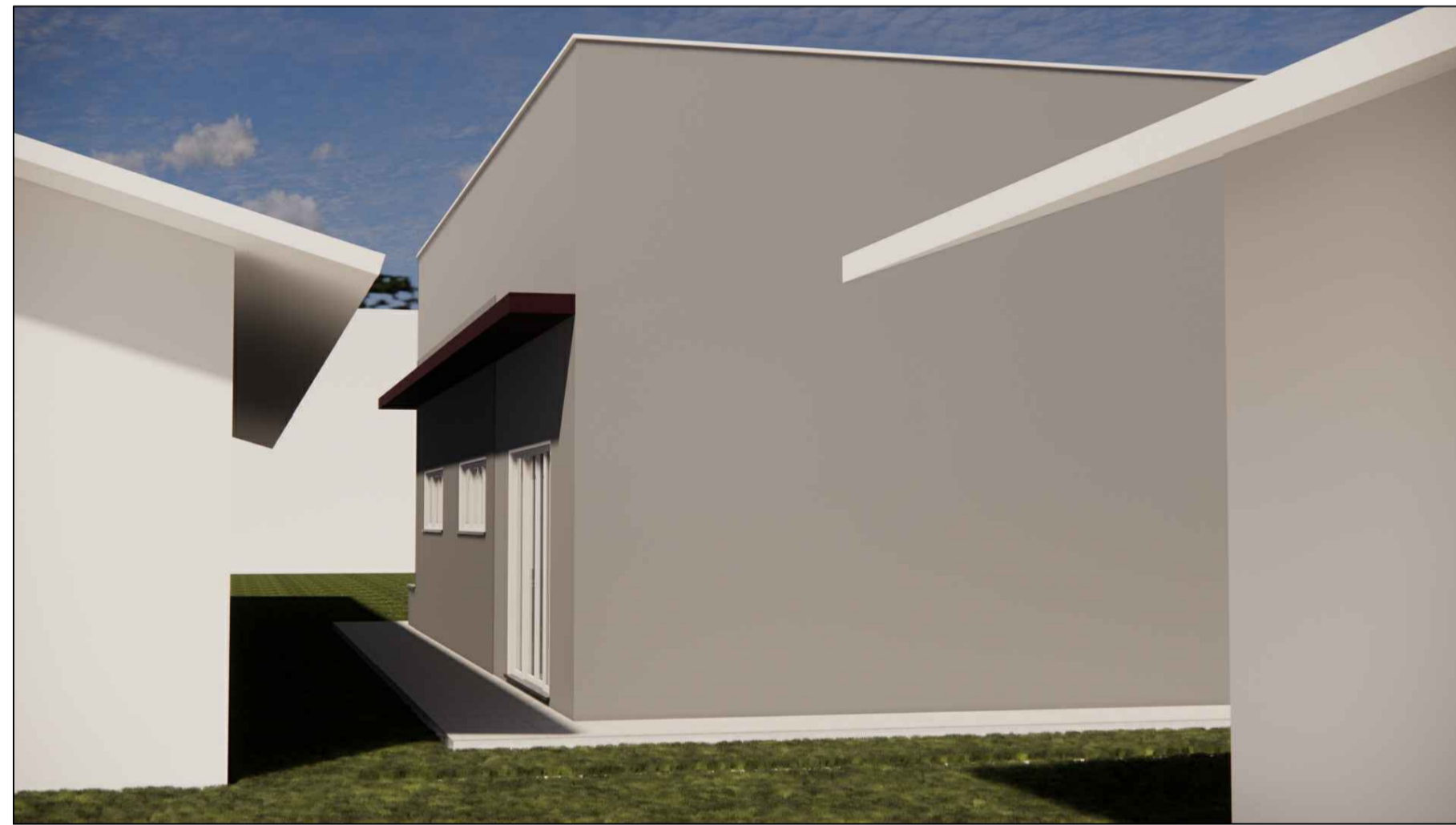
A15 VISTA ENTRE EDIF. EXISTENTES (ESCOLA E POSTO DE SAÚDE) ESC. S/E