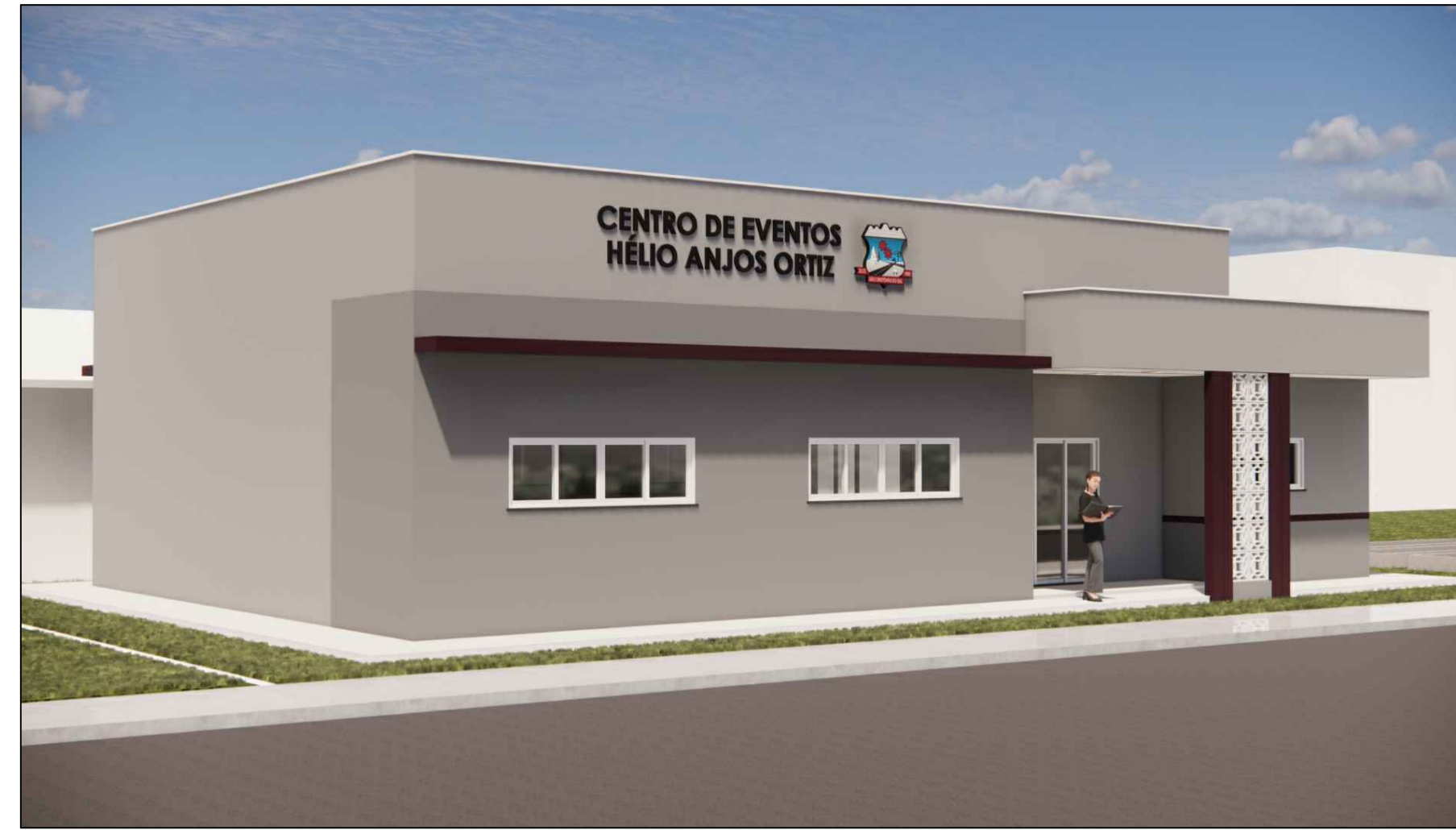
A14 VISTA EM PERSPECTIVA DA FACHADA (SEM MURO) ESC. S/E