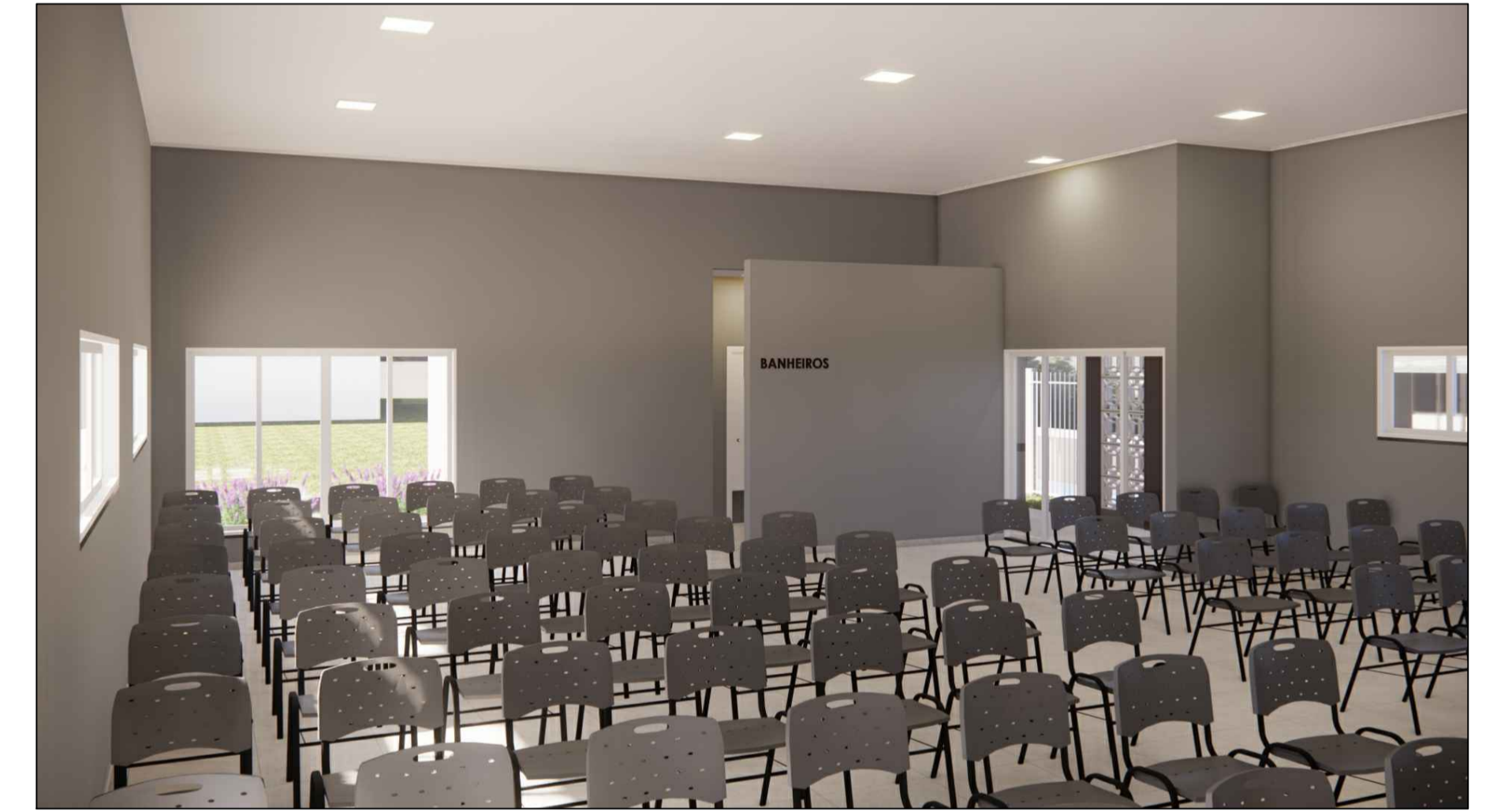
A18 VISTA INTERNA (SUGESTÃO LAYOUT CADEIRAS) ESC. S/E