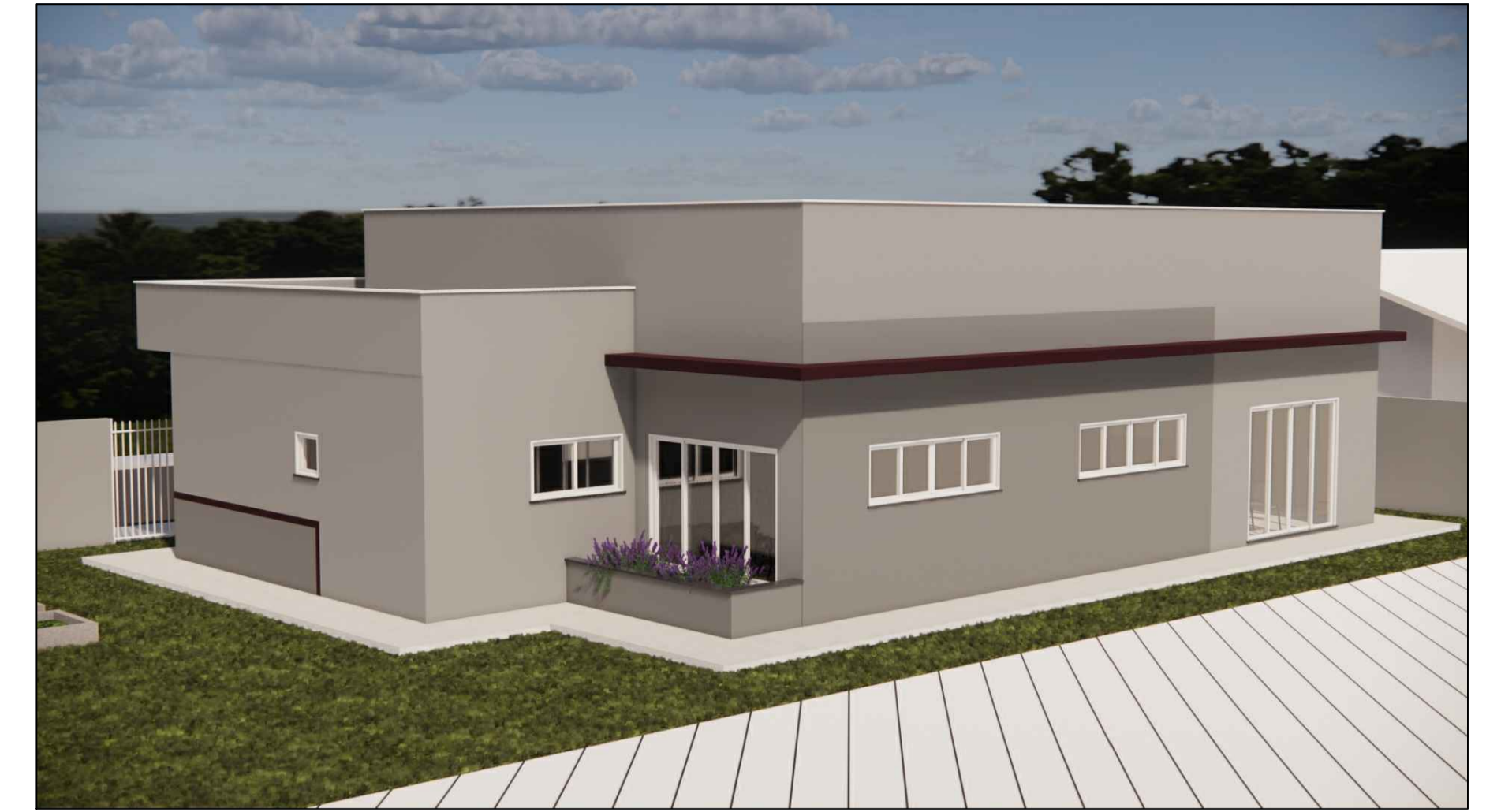
A16 VISTA DA VISTA DA FLOREIRA DA EDIFICAÇÃO À CONSTRUIR ESC. S/E