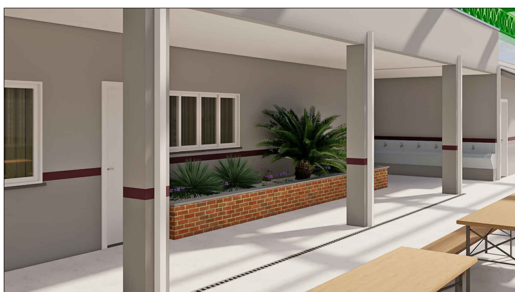
A22 VISTA DA FLOREIRA DA COZINHA ESC. S/E