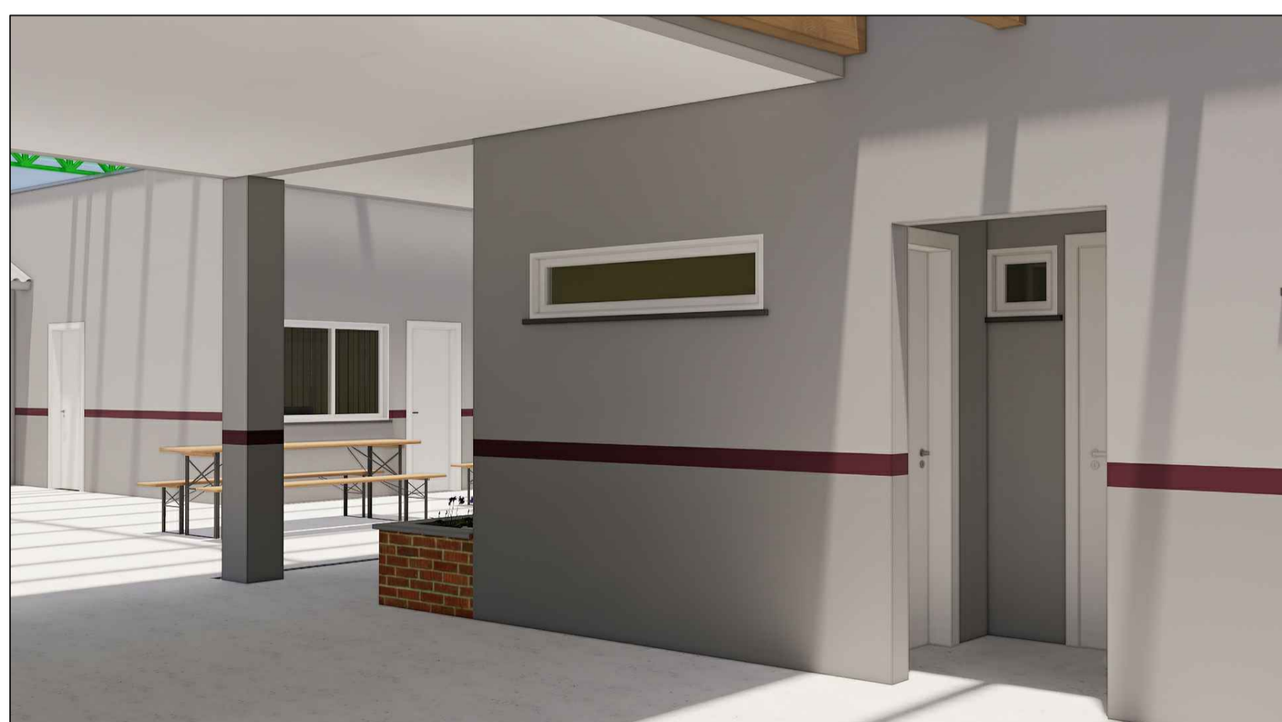
A19 ENTRADA DO BANHEIRO PROFESSORES ESC. S/E