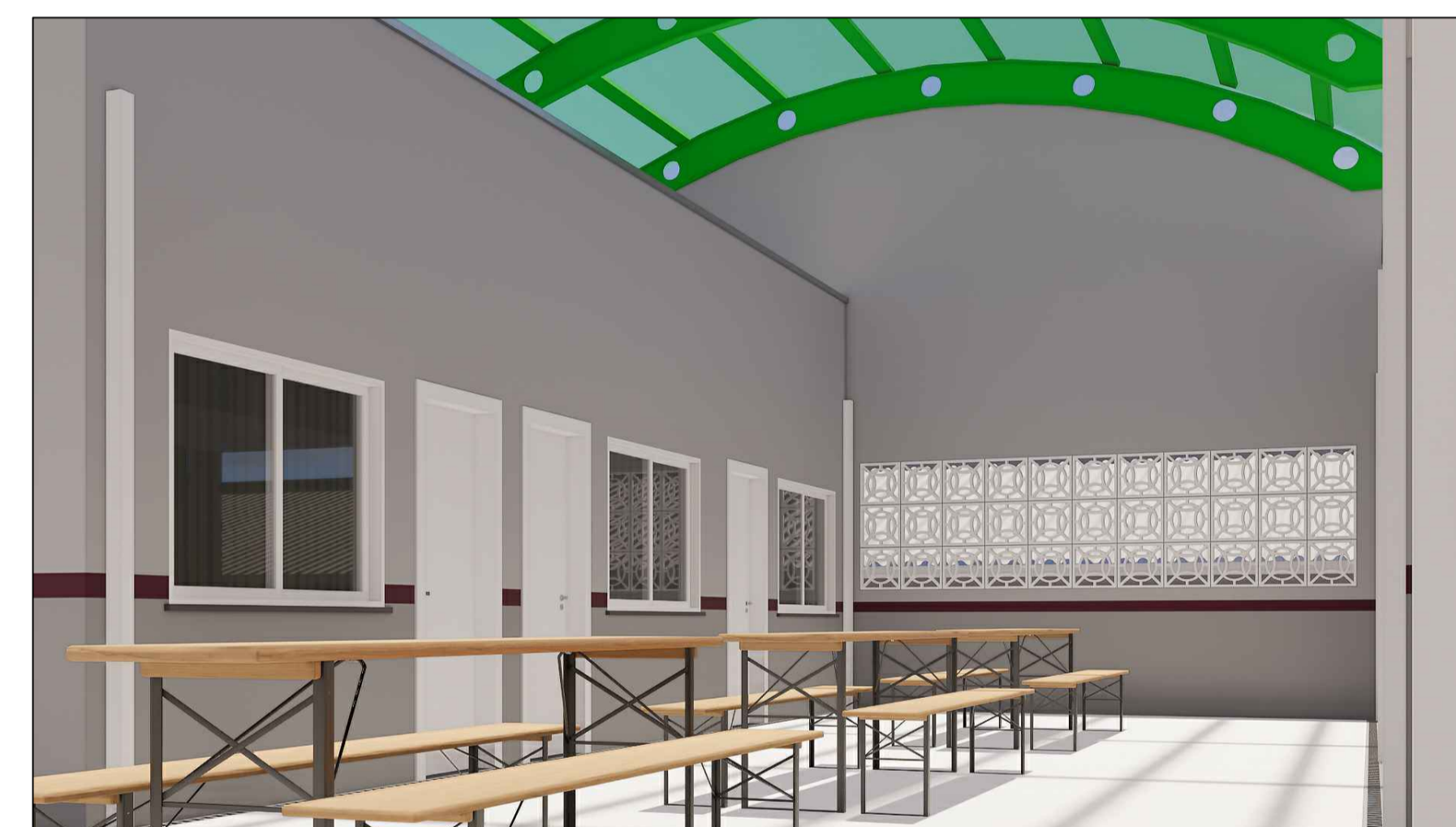
A20 VISTA DO OITÃO FECHADO/ COBOGÓS ESC. S/E