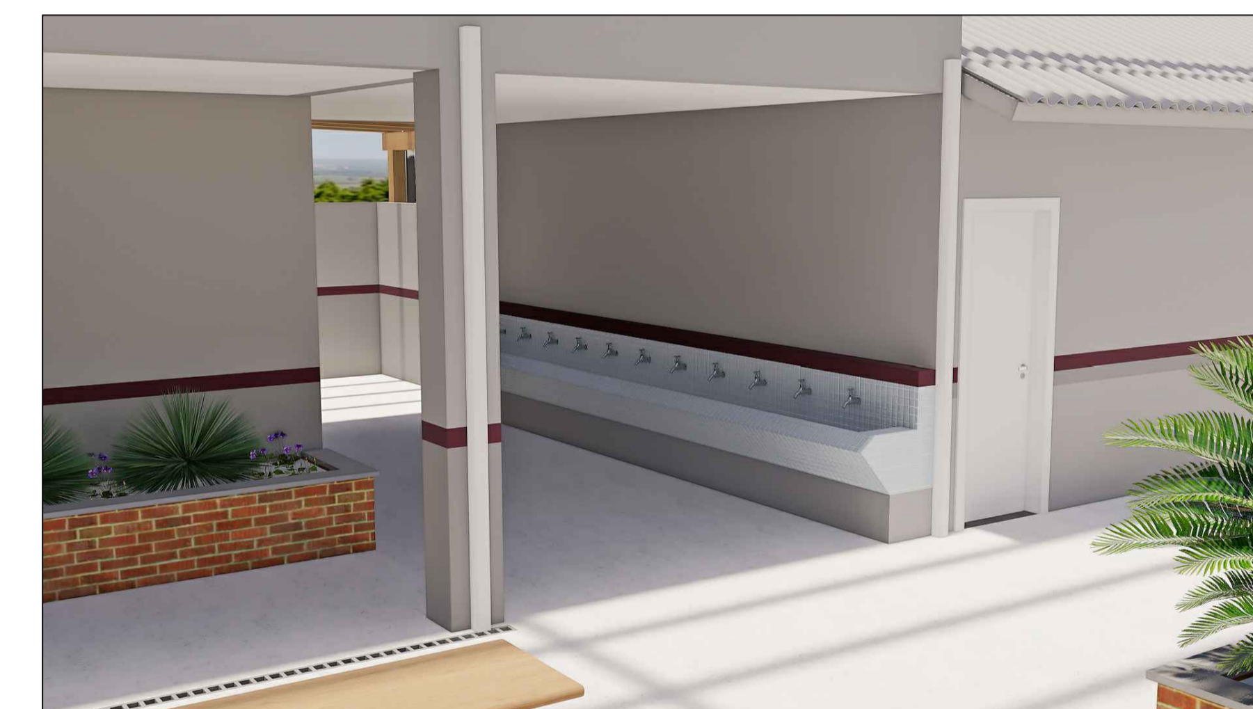
A21 VISTA DOS NOVOS LAVATÓRIOS ESC. S/E