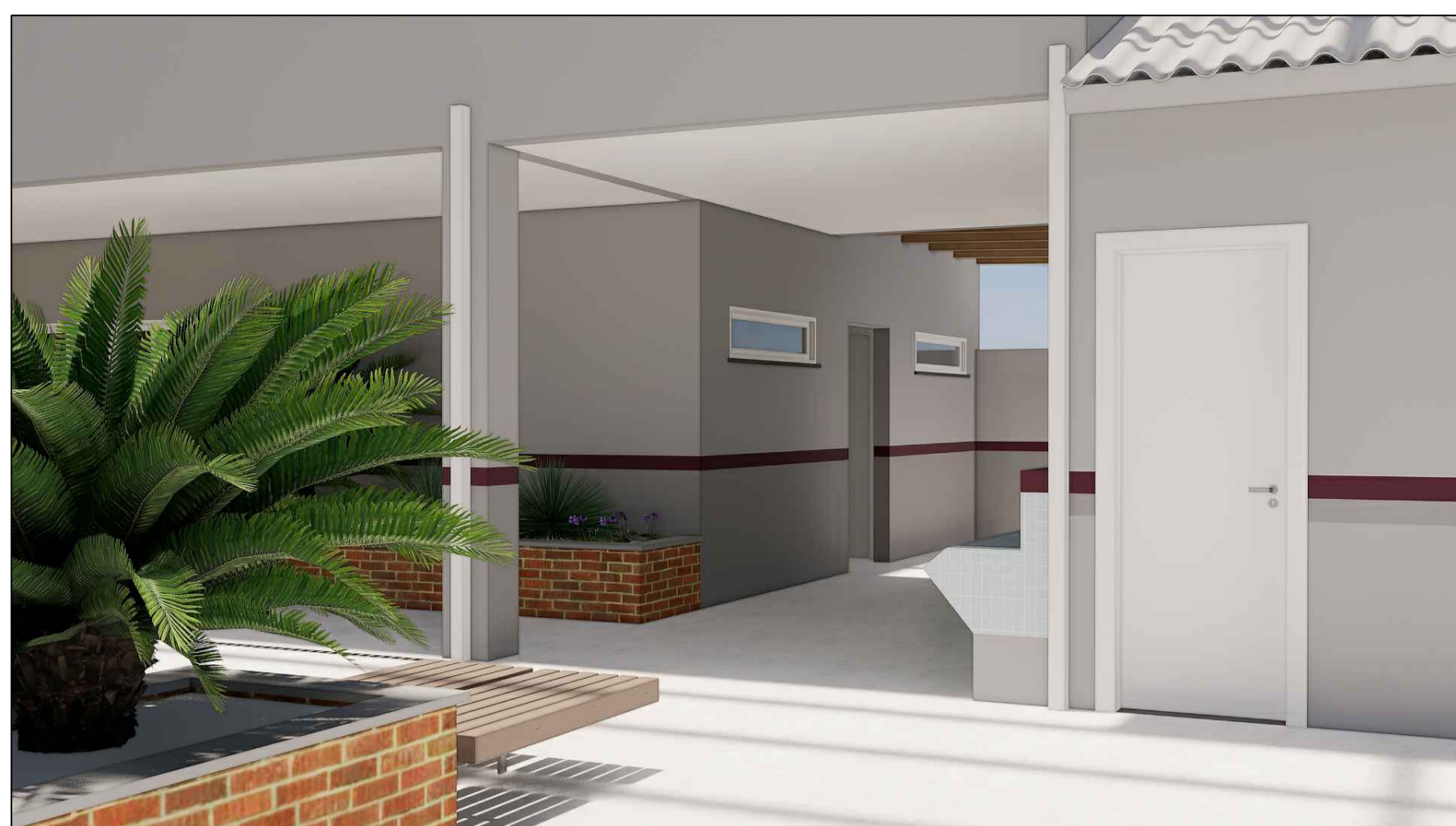
A16 VISTA DO ACESSO AOS NOVOS BANHEIROS ESC. S/E