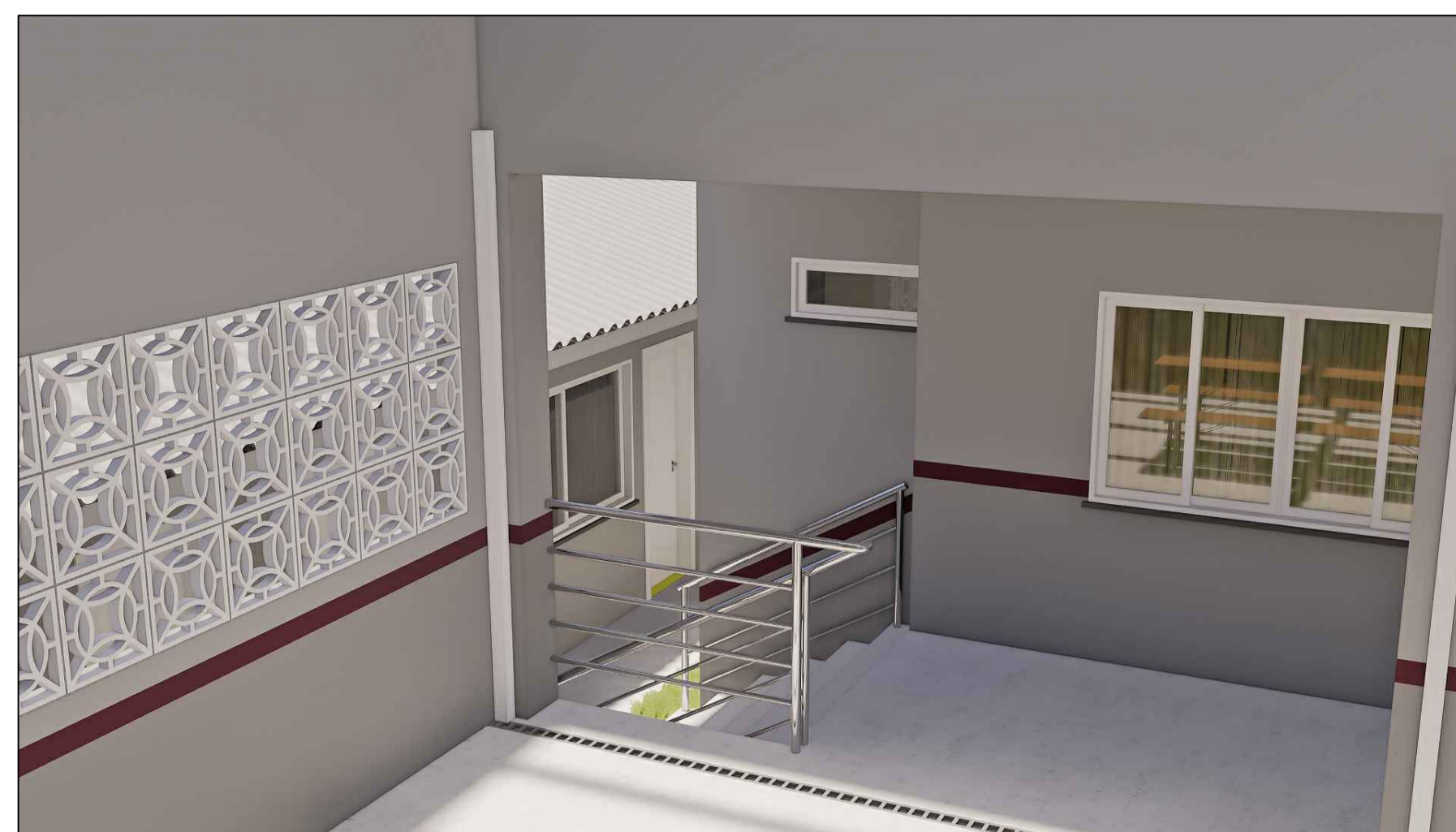
A17 ESCADA DE ACESSO A EDIFICAÇÃO EXISTENTE ESC. S/E