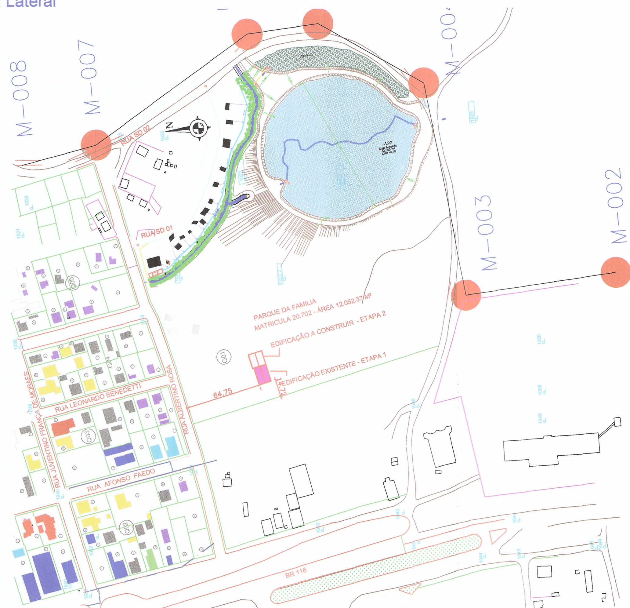
PLANTA DE LOCAÇÃO - ESC 1/2000