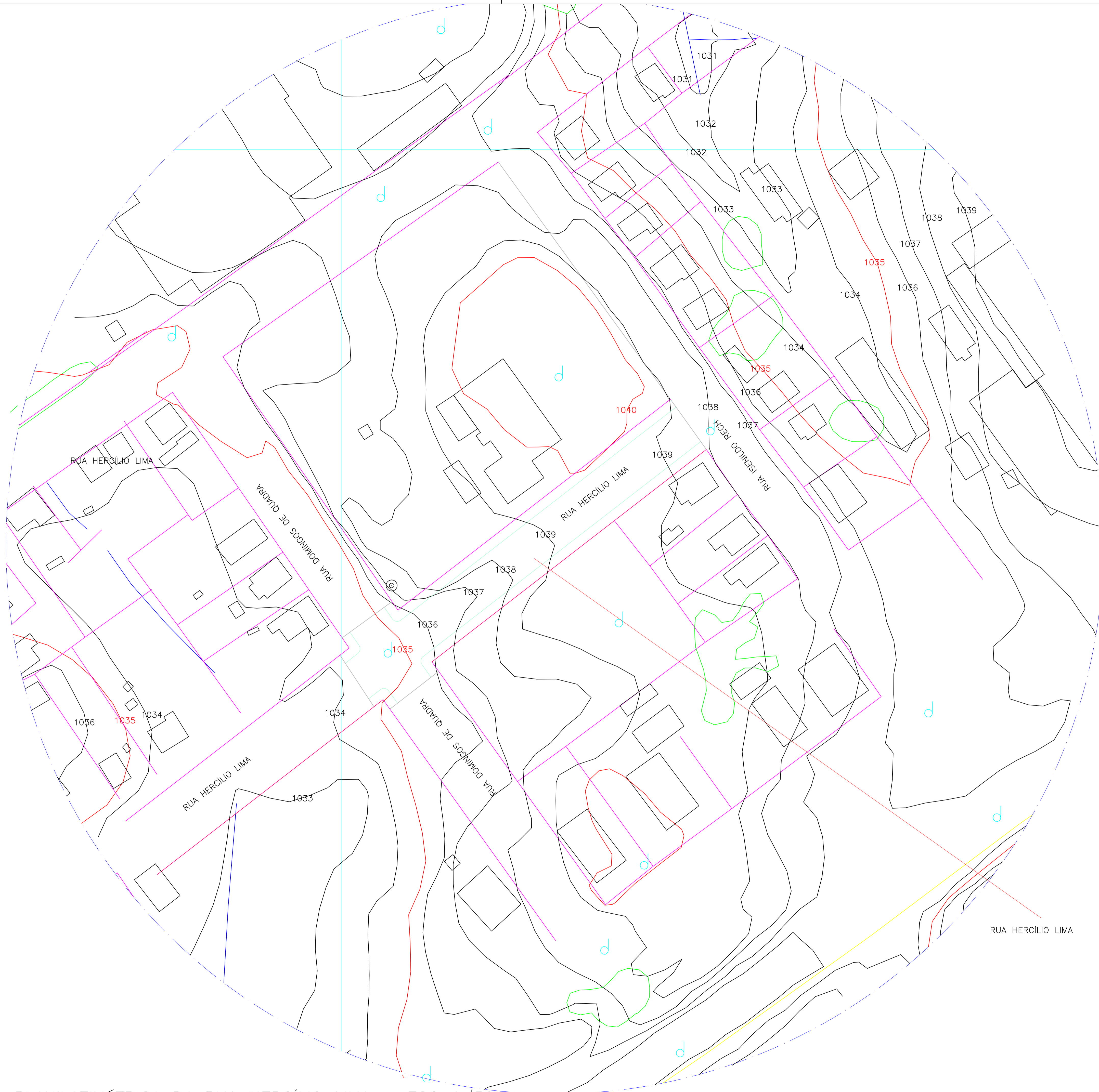
PLANTA PLANILATIMÉTRICA DA RUA HERCÍLIO LIMA – ESC 1/500