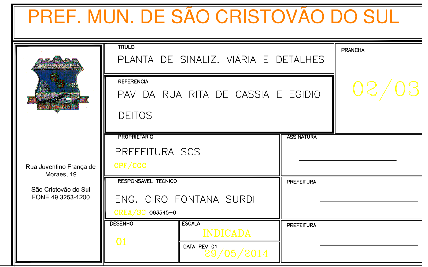
PLANTA SINALIZAÇÃO VIÁRIA RUA EGÍDIO DEITOS TRECHO EST 0+320,00 A 0+450,76- ESC 1/250

RUA EGÍDIO DEITOS - TRECHO estaca 0+320,00 até 0+450,76 - Extensão 130,76 Largura 10,00 - Passeio 2,00 m