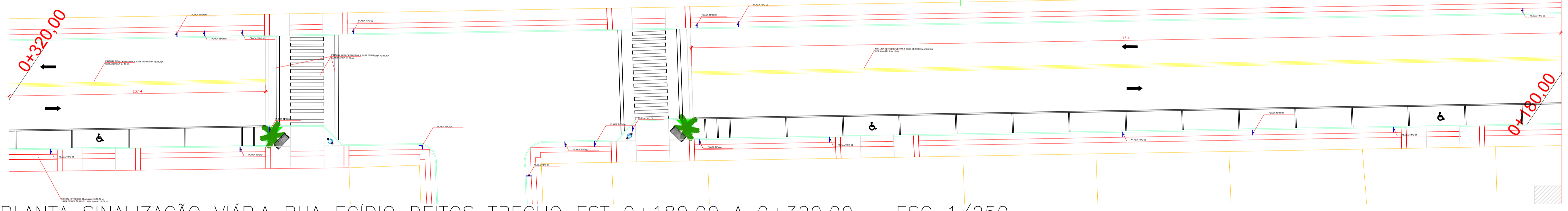
PLANTA SINALIZAÇÃO VIÁRIA RUA EGÍDIO DEITOS TRECHO EST 0+180,00 A 0+320,00 - ESC 1/250