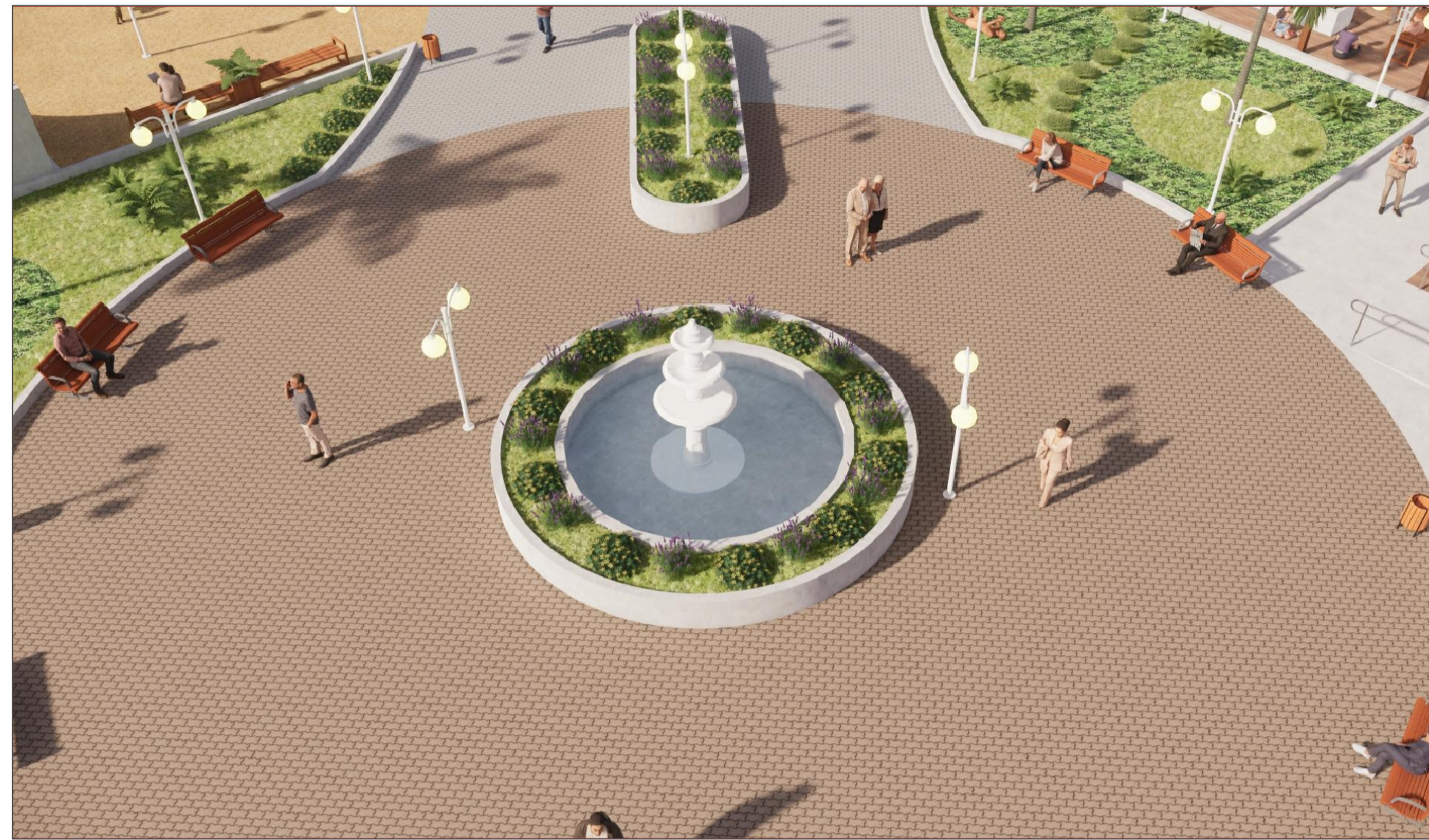
PERSPECTIVA 3D VISTA DO CHAFARIZ