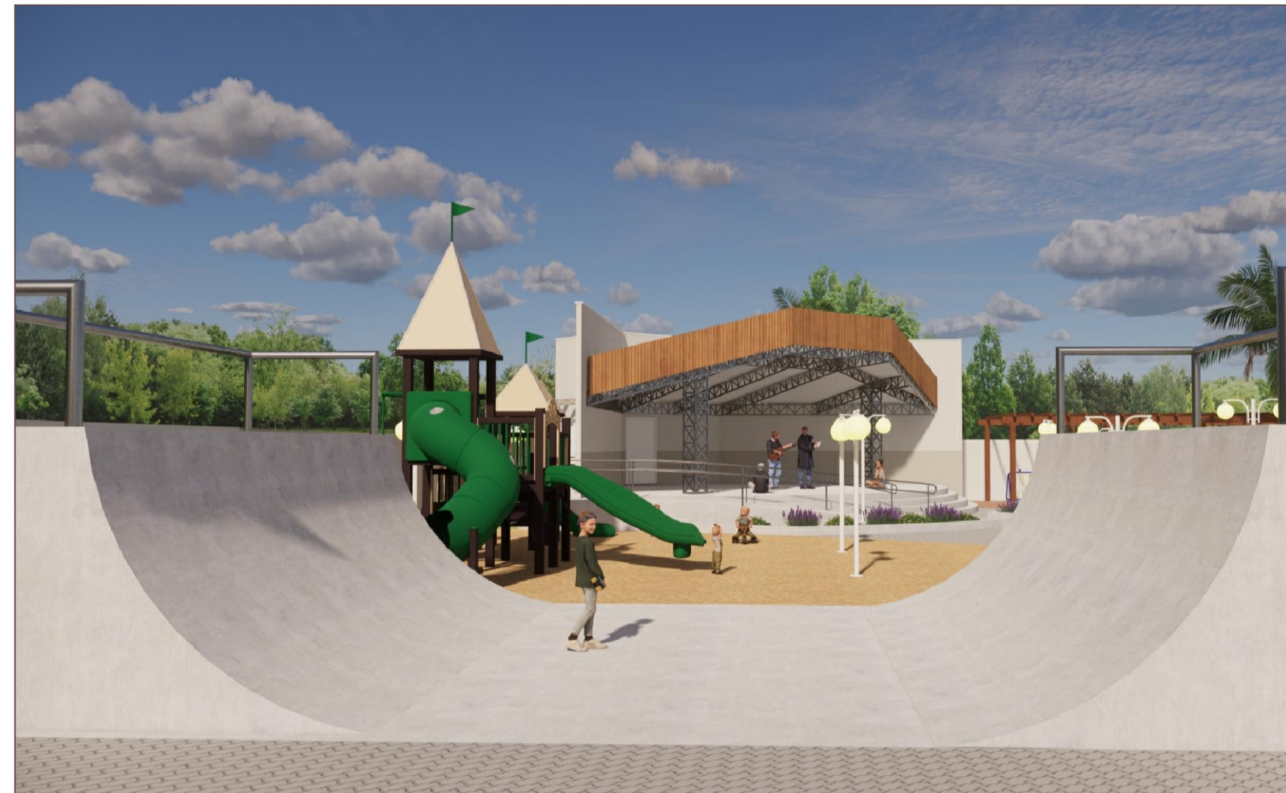
PERSPECTIVA 3D VISTA DA PISTA DE SKATE