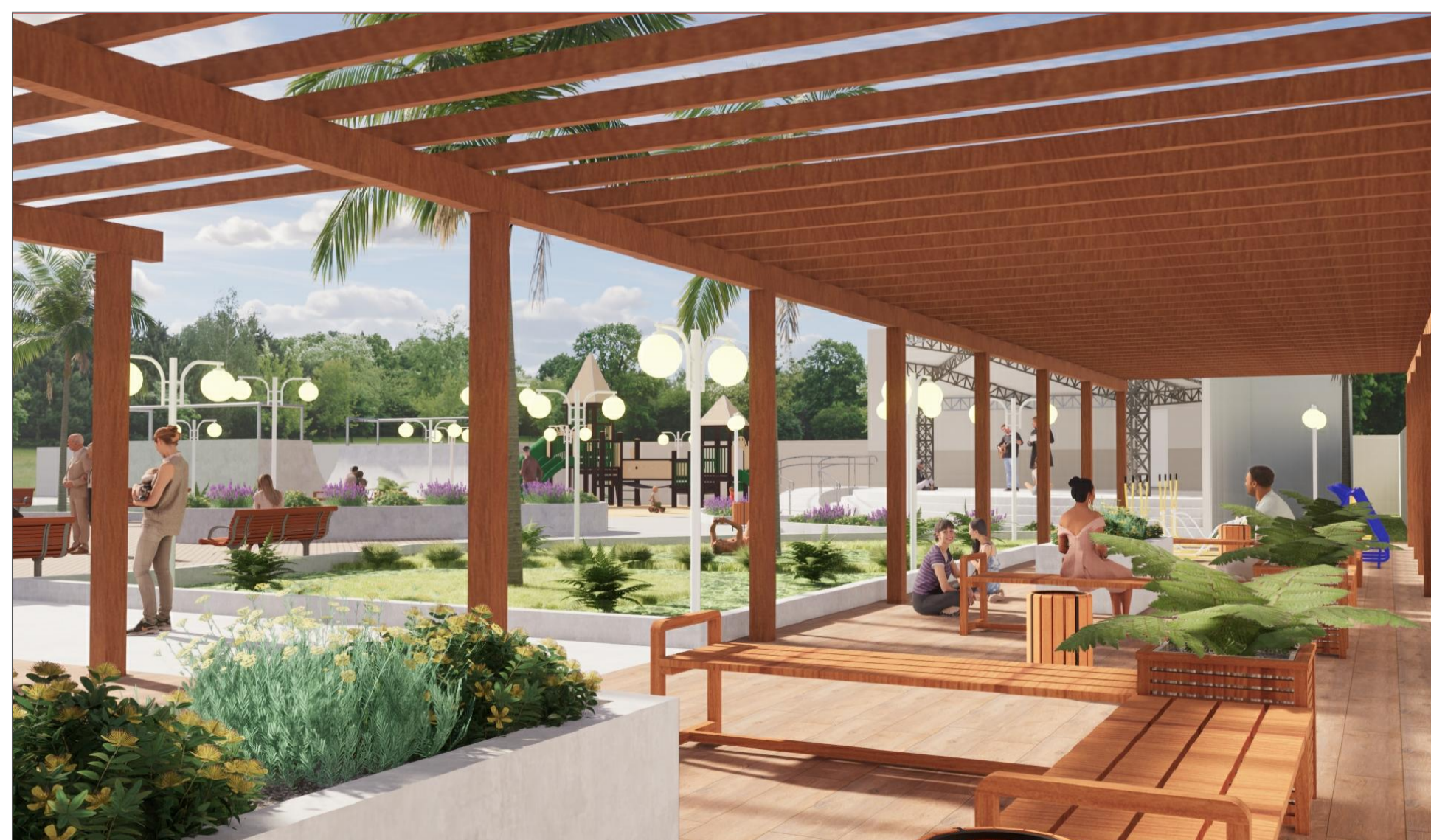
PERSPECTIVA 3D VISTA INTERNA DO PERGOLADO