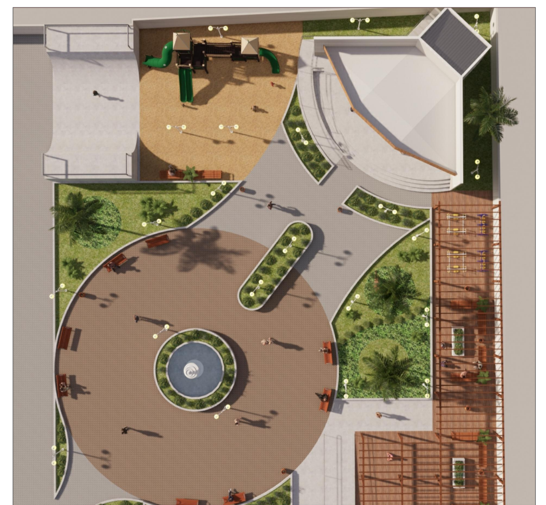
PERSPECTIVA 3D VISTA AÉREA