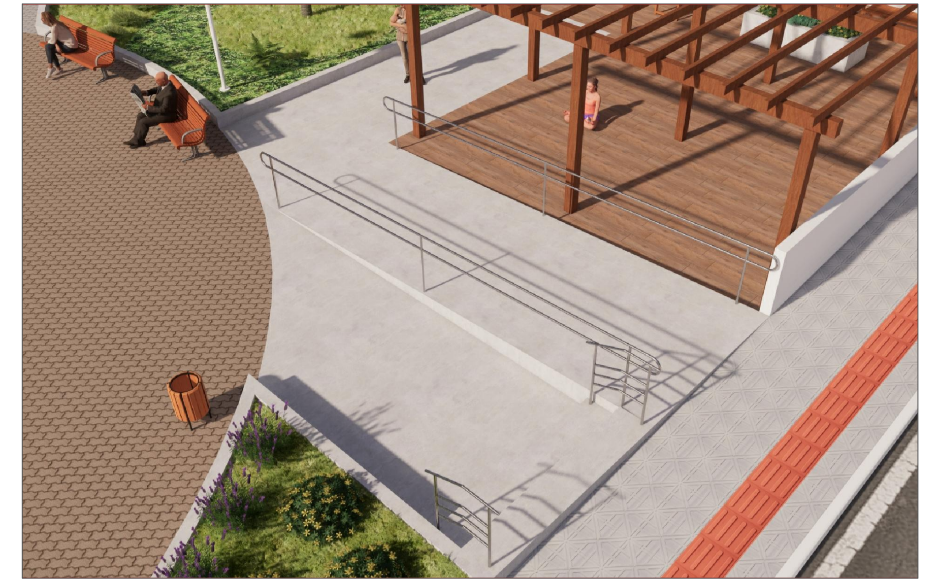
PERSPECTIVA 3D VISTA DO ACESSO (ESCALA E RAMPA)