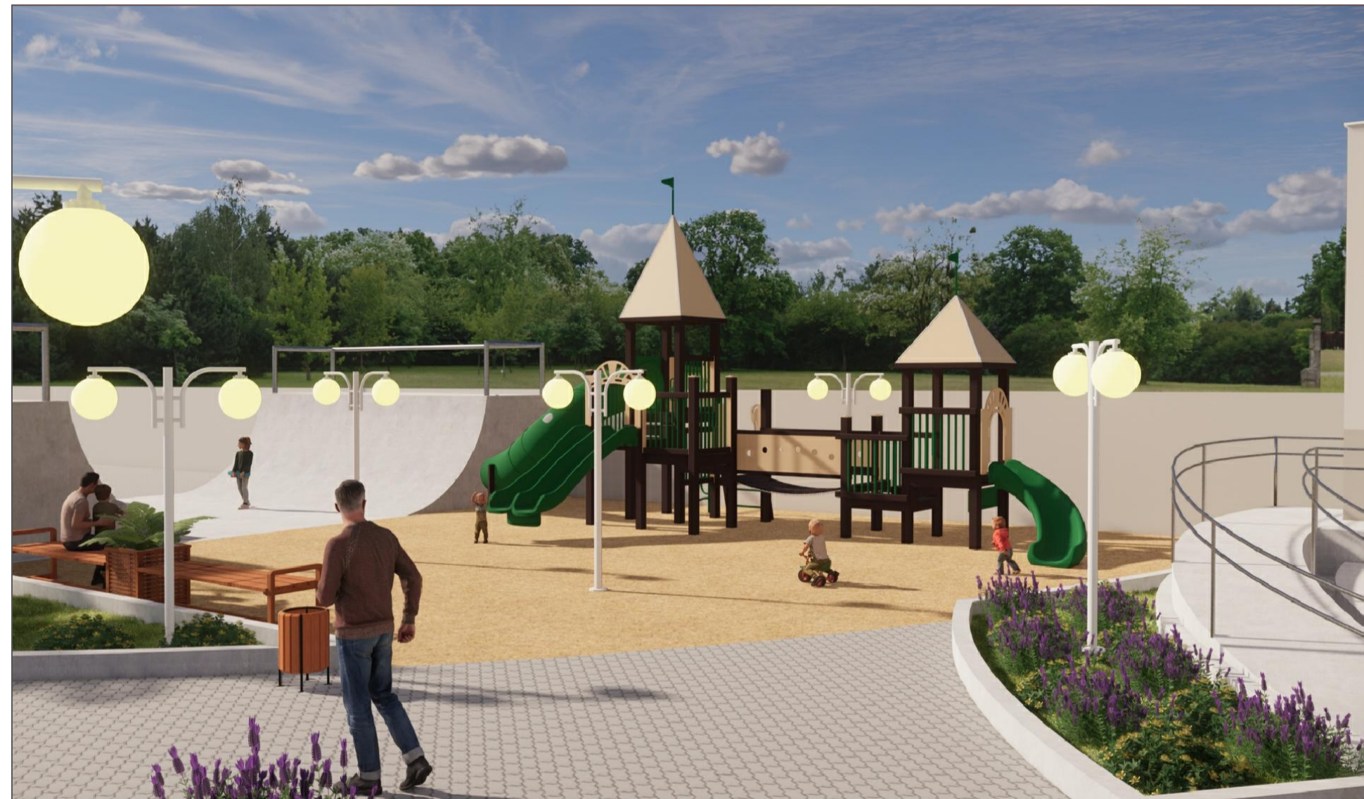
PERSPECTIVA 3D VISTA DO PLAYGROUND E PISTA DE SKATE