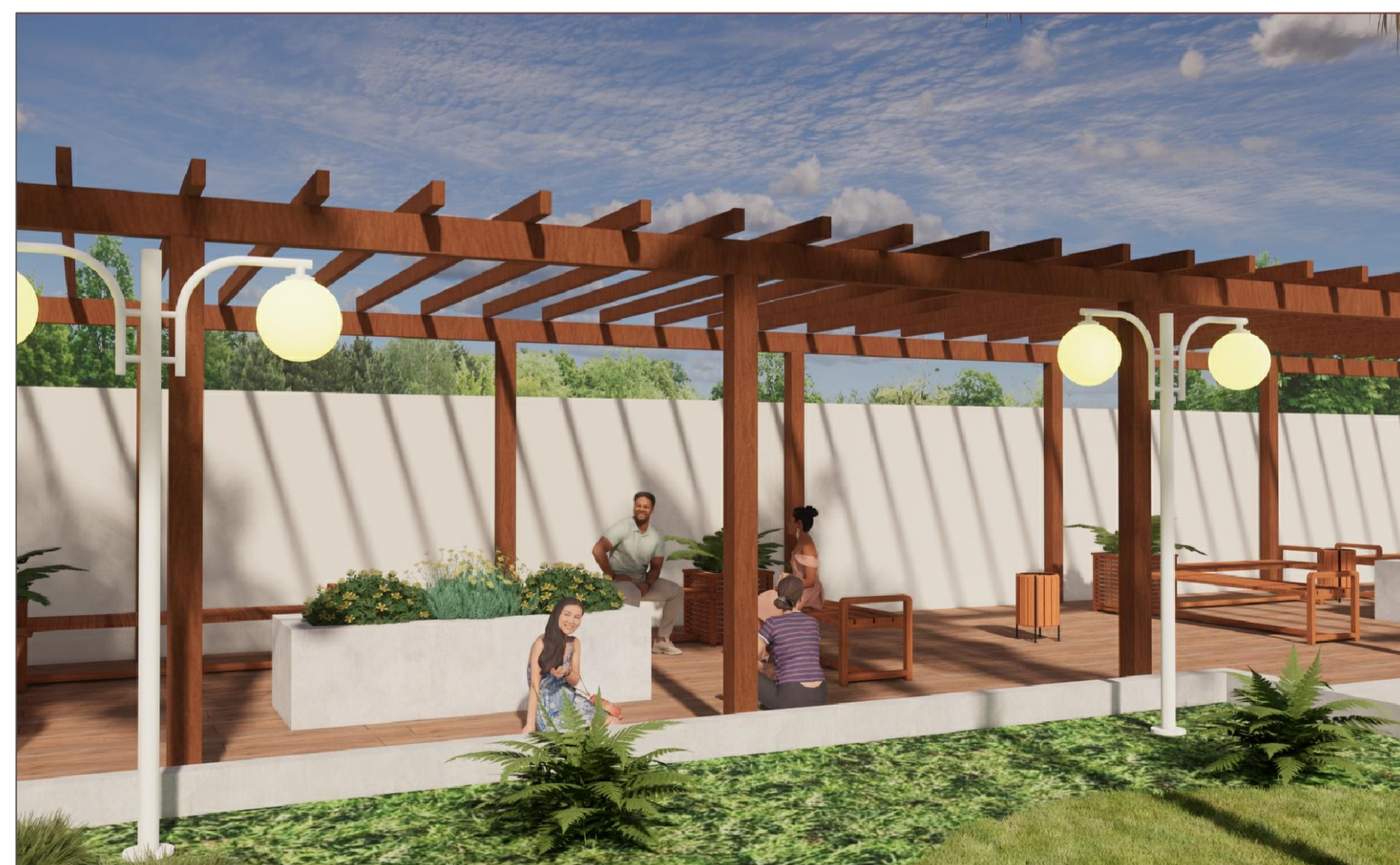
PERSPECTIVA 3D VISTA DO PERGOLADO