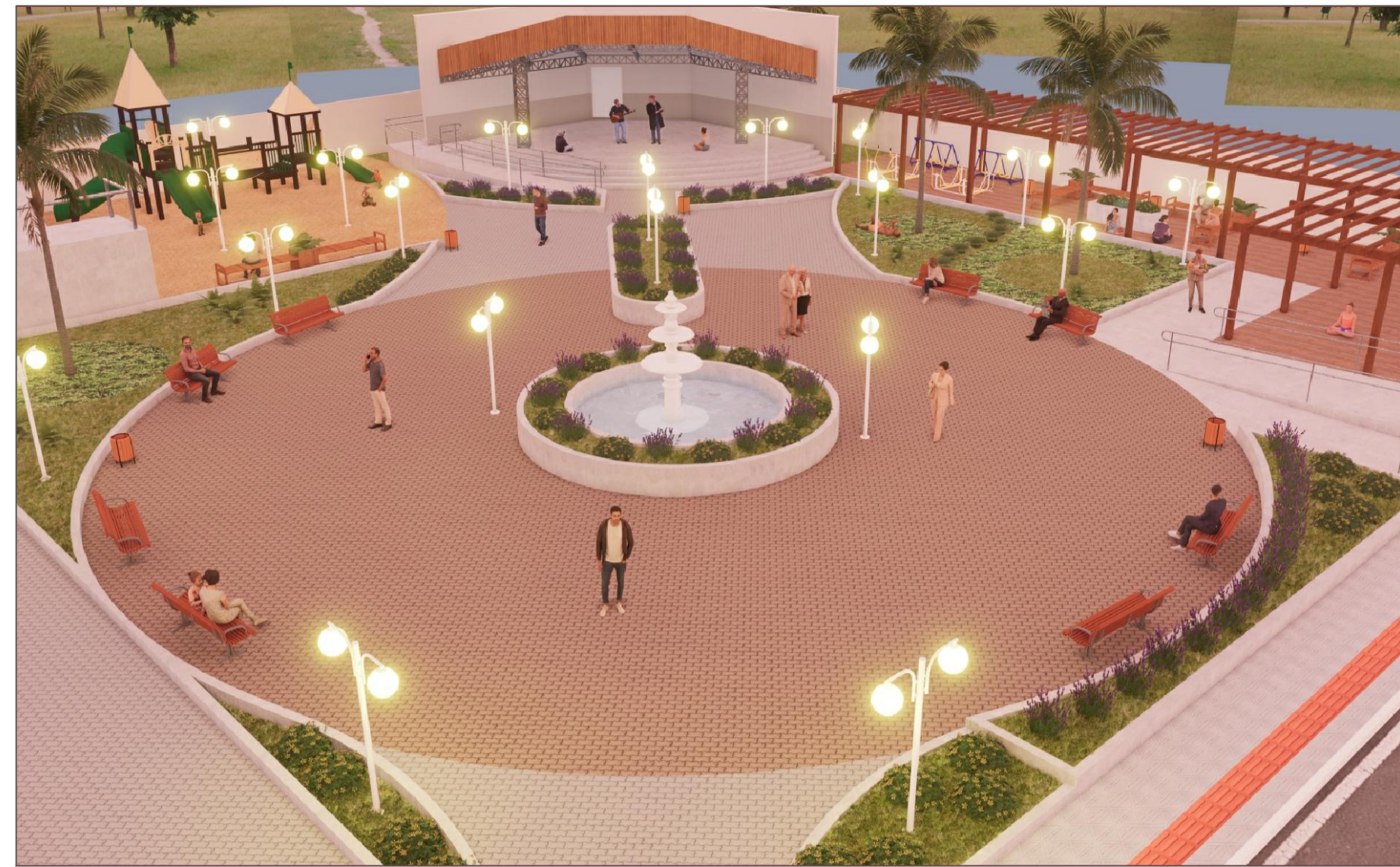
PERSPECTIVA 3D VISTA PANORÂMICA