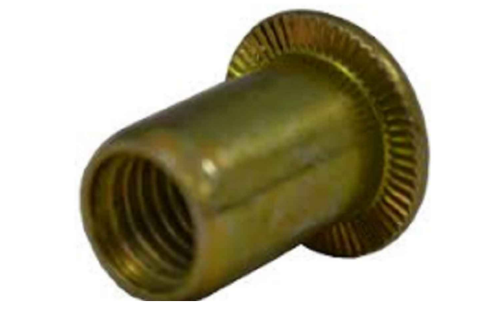
bucha de metal com rosca 450x298 mm