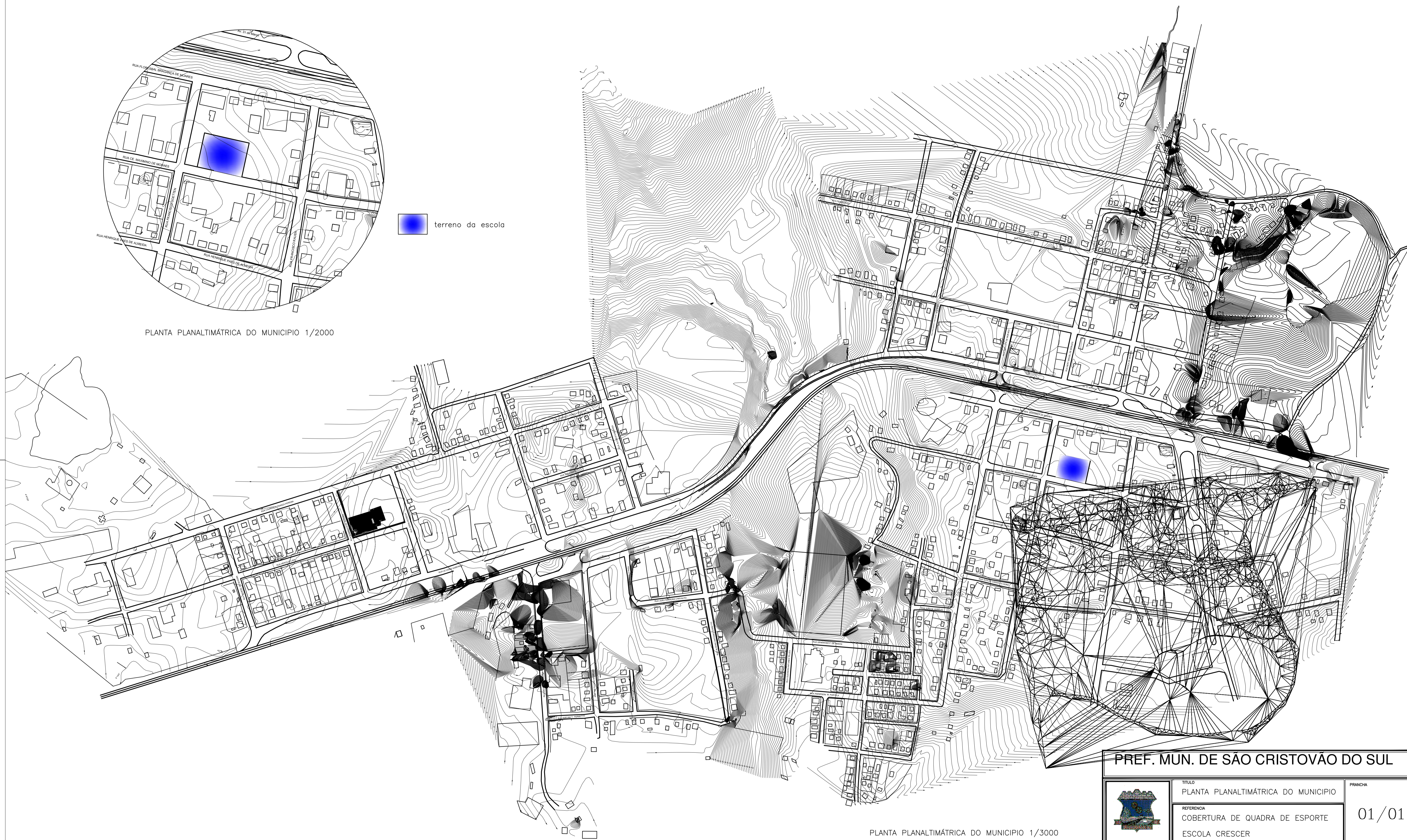
PLANTA PLANALTIMÉTRICA DO MUNICÍPIO 1/3000