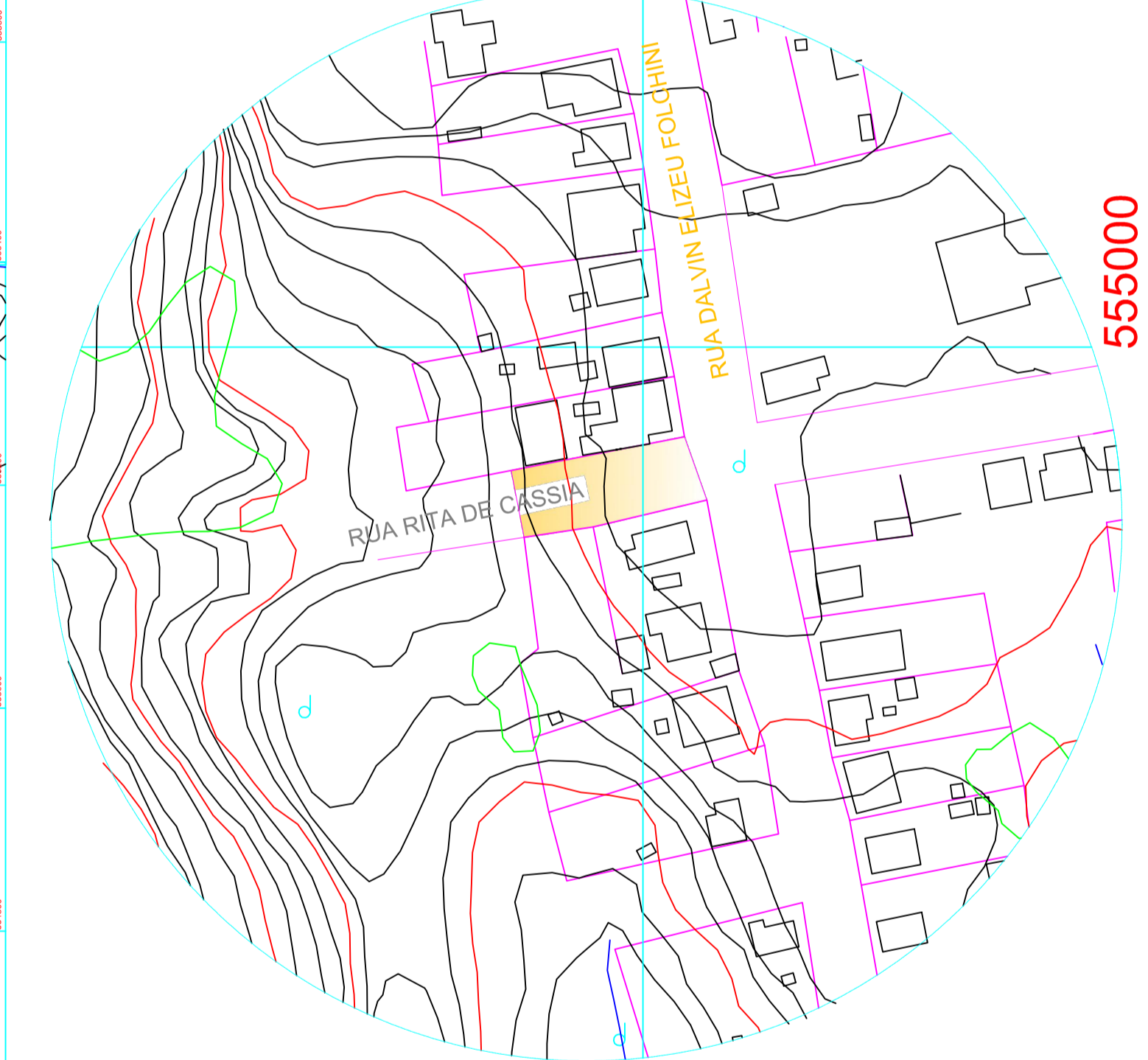
DETALHE 04 - ESC 1/750

DETALHE 04 Pav Trecho Rua Rita de Cássia Coor Geografica: Lat 27°15'52,5"S Long. 50°26'44,4"O